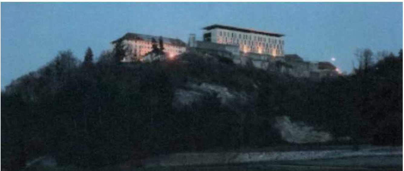
Die Berner Justizvollzugsanstalt Thorberg.

Die Schilderungen werden von Experten bestätigt. «In gut informierten Kreisen gilt der Thorberg als