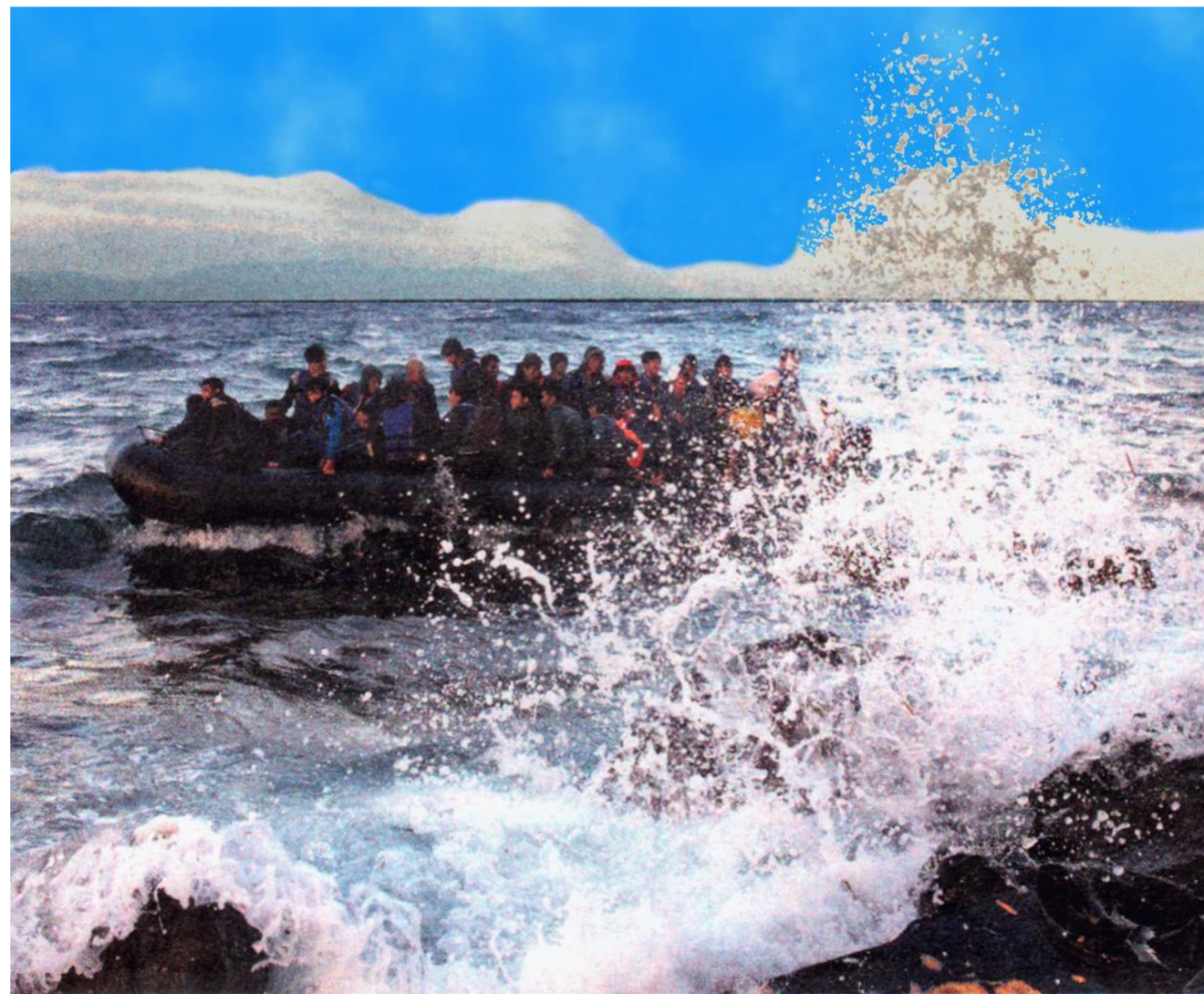
Flüchtlinge auf dem Mittelmeer

Im Übrigen gründet der wahre Mut darauf, dass wir, auch wenn wir Angst haben, trotzdem tapfer voranschreiten, der Zukunft entgegen. Die Zukunft wird nämlich so oder so eintreffen. Da ist es besser, ihr Auge in Auge gegenüberzutreten, als sich von ihr, feige und in einem dunklen Loch kauern, in einer halb realen und halb imaginären Vergangenheit erwischen zu lassen.