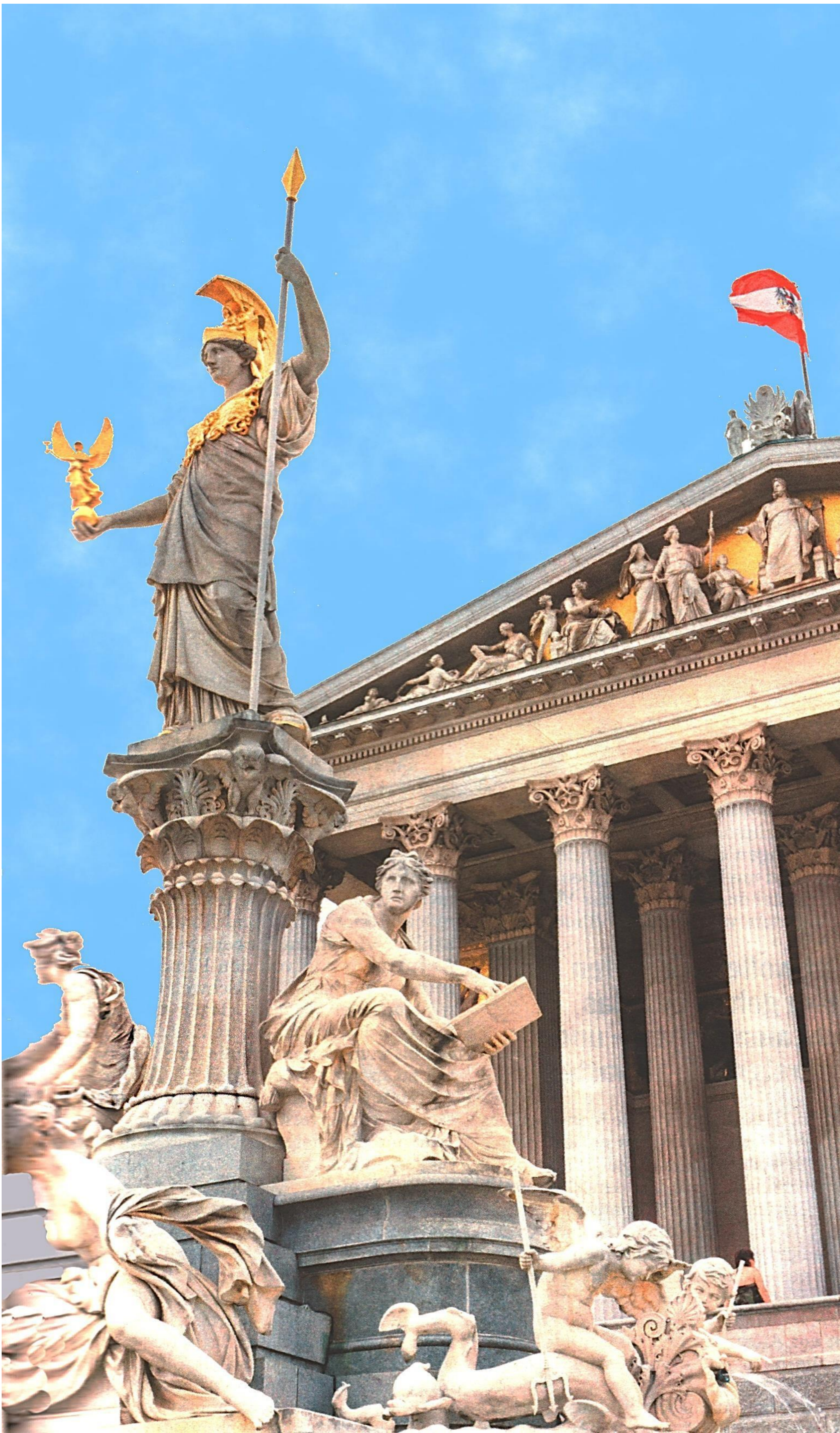
Parlament in Wien

„Können sich gefallene Imperien nicht etwas bescheidener aufführen?“