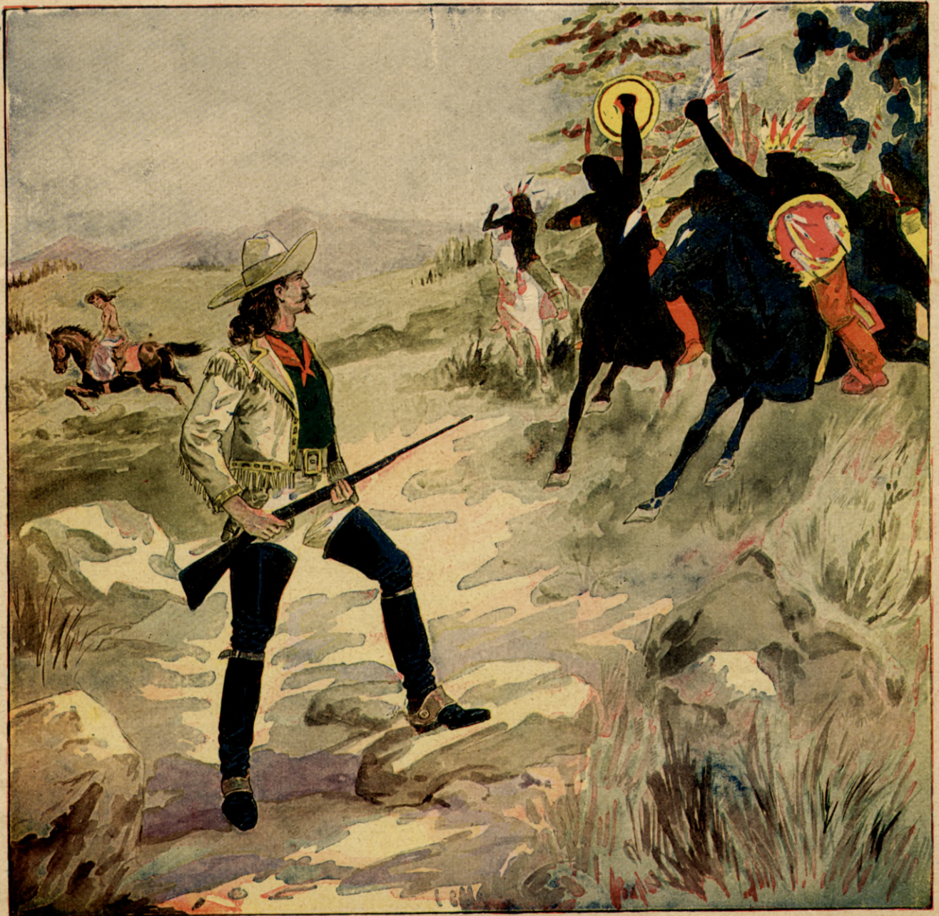
Als Mabel rückwärts blickte, sah sie Buffalo Bill, wie ein Löwe zum Sprung bereit, während die Wilden auf ihn losstürmten.